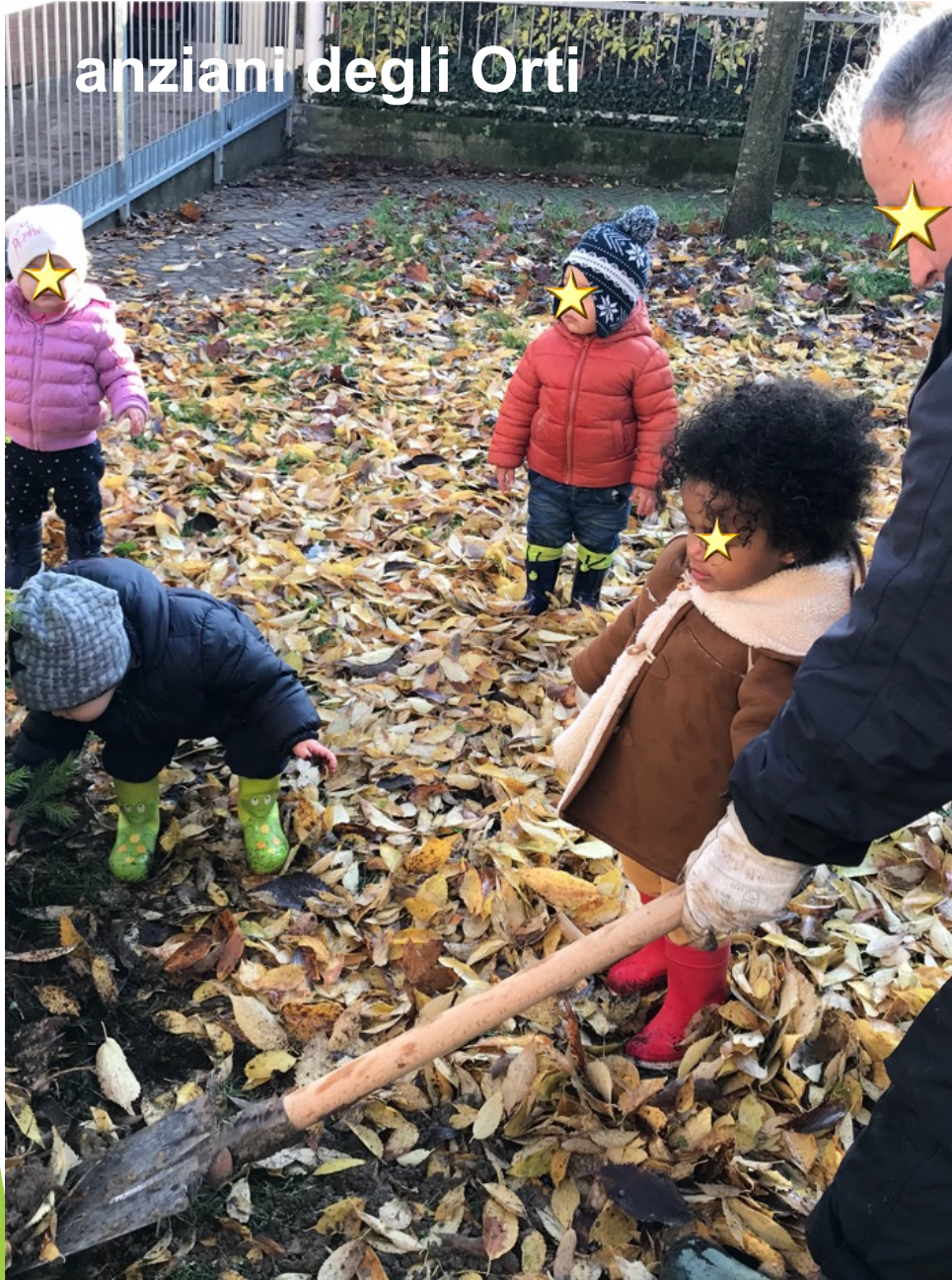
anziani degli Orti